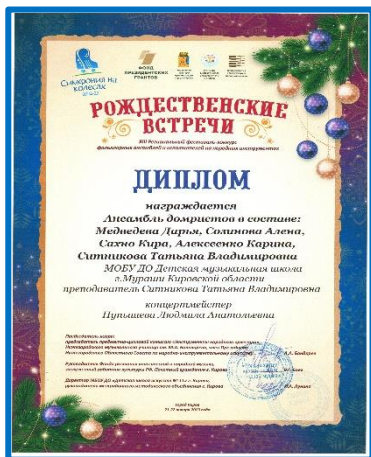
Ансамбль домристов — Диплом