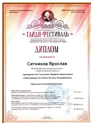
Ситников Ярослав, номинация «концертмейстер» - Диплом