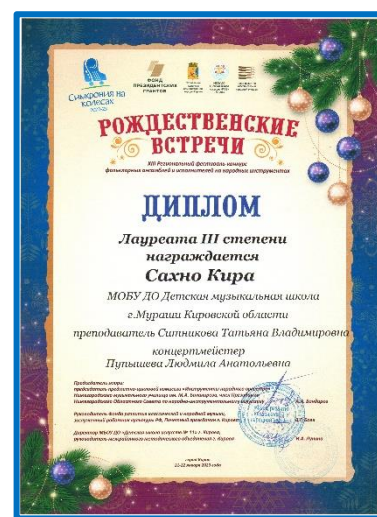
Сахно Кира – Диплом