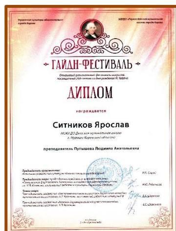
Ситников Ярослав, номинация «СОЛИСТ» - Диплом